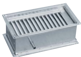
pohled na spodní stranu eliminátoru s hrdlem odvodu kondenzátu